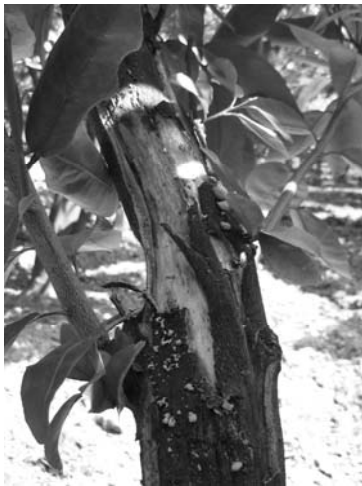
شکل ۲- علائم پوسته پوسته شدن تنه (پرتقال روی پایه نارنج)

عبارت از علائم نقش برگ بلوطی روی پهنک برگ و نقوش ایجاد شده روی برگ‌های جوان (شکل ۱)، پوسته پوسته شدن تنه اصلی (شکل ۲) و شاخه‌ها (شکل ۳) بود. از درختان دارای آلودگی عکس‌برداری شد و مناطق دارای درختان آلوده مشخص گردید، تا جهت ردیابی‌های سرولوژیکی و مولکولی آزمایشات تکمیلی در مورد آنها انجام پذیرد.