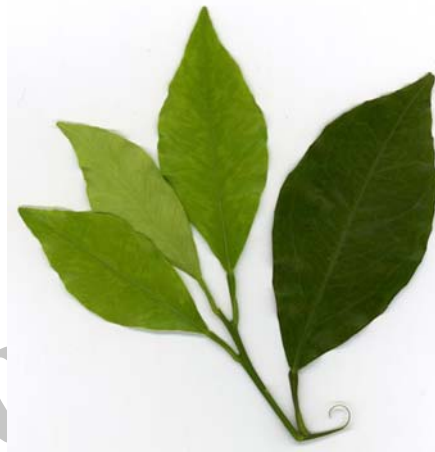
شکل ۱- علائم نقش برگ بلوطی روی پهنک برگ (پرتقال روی پایه نارنج)