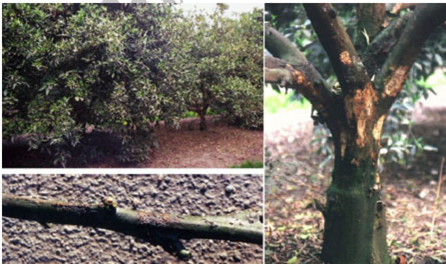
شکل ۳- علائم پوسته پوسته شدن شاخه (پرتقال روی پایه نارنج)