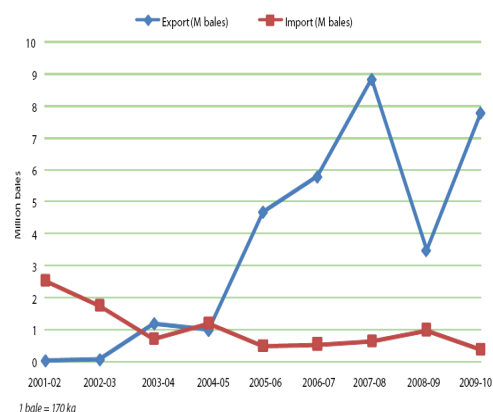
شکل ۱- صادرات و واردات پنبه در هندوستان از سال ۲۰۰۱ الی ۲۰۱۰

کرم غوزه و بیماری قارچی Verticillium dahlia و به‌ترتیب از مهم‌ترین آفات و بیماری‌های پنبه هستند که سالیانه خسارت زیادی وارد می‌کنند. هر سال بطور متوسط در سطح ۹۰ تا ۱۲۰ هزار هکتار از مزارع پنبه کشور علیه آفت کرم غوزه به دفعات