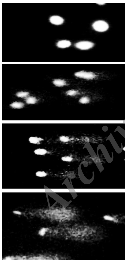
شکل ۱- درجه های مختلف آسیب مشاهده شده در DNA اسپرماتوزوئیدها

دقیقه شستشو داده شده و برای فیکس کردن در اتانول خالص به مدت ۵ دقیقه قرار داده شده و بعد در مجاورت هوا خشک شدند. قبل از مشاهده لام ها توسط میکروسکوپ با افزودن رنگ اتیدیم بروماید (۲۰ μg/ml) رنگ آمیزی شده و به کمک میکروسکوپ اپی فلوئورسانس (Zeiss, Germany)، تصاویر دیجیتال از نمونه های هر لام تهیه شد (شکل ۱). برای هر تیمار ۳ عدد پایوت و از هر پایوت ۳ عدد لام تهیه شد که در هر کدام ۱۰۰ سلول بصورت تصادفی در نقاط مختلف لام مورد بررسی قرار گرفت. یکی از مهمترین پارامترها که قضاوت در مورد میزان آسیب وارده به DNA بر مبنای آن انجام می شود، درصد کمی DNA دنباله ۱ (%DNA T ) است (Konca et al. 2003)، که توسط نرم افزار Comet Score™ V 1.5 بر طبق رابطه زیر (معادله ۱) مورد ارزیابی قرار گرفت که در آن دنباله ۲ T و سر ۳ H سرکامت است. معادله ۱ \%DNA_T = 100 \times (DNA_C - DNA_H) / DNA_C لازم به ذکر است که سلول های با DNA T بالای ۷۵ درصد - به عنوان شاخص آپوپتوزیس- مورد بررسی و آنالیز قرار نگرفتند. پس از اندازه گیری فاکتورهای مطرح شده و ثبت آنها بصورت میانگین ± انحراف معیار در سطح ۹۵ درصد ( P < 0/05 ) توسط آنالیز واریانس یک طرفه (One-Way ANOVA) با استفاده از نرم افزار SPSS با یکدیگر مقایسه شدند. نمودارها نیز با استفاده از برنامه EXCEL ترسیم شد.