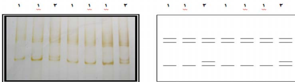
شکل ۲- باندهای ایجاد شده توسط آغازگر مورد استفاده روی ژل اکریلامید ۸ درصد. عدد ۱ و ۲ به ترتیب مربوط به الگوهای ژنتیکی A و B هستند.

سوماتیک ( P < 0.01 )، درصد پروتئین و همچنین درصد چربی شیر ( P < 0.05 ) مرتبط بود (Beecher et al. 2010).