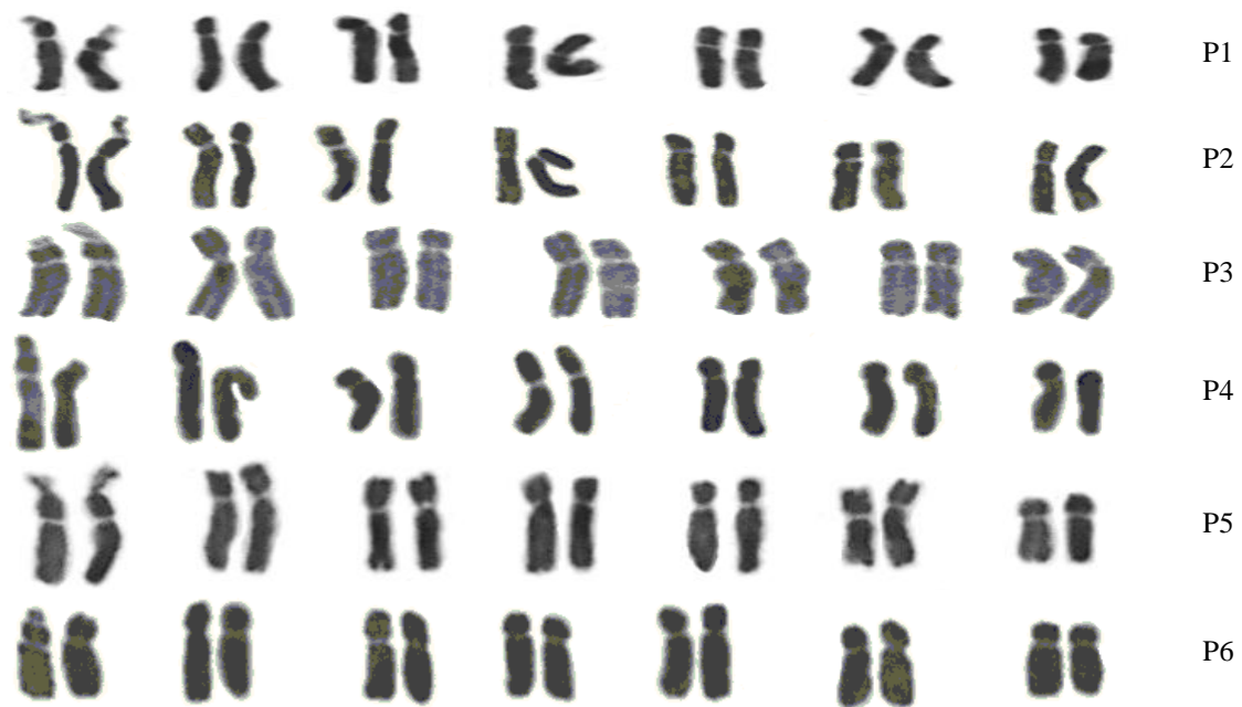
شکل ۲- کاریوگرام شش جمعیت مورد مطالعه از گونه P. fugax

نسبت بلندترین کروموزوم به کوتاهترین کروموزوم (R)، دامنه طول نسبی کروموزوم‌ها (DRL)، درصد فرم کلی کاربوتیپ (%TF)، شاخص تقارن استیبینز (ST)