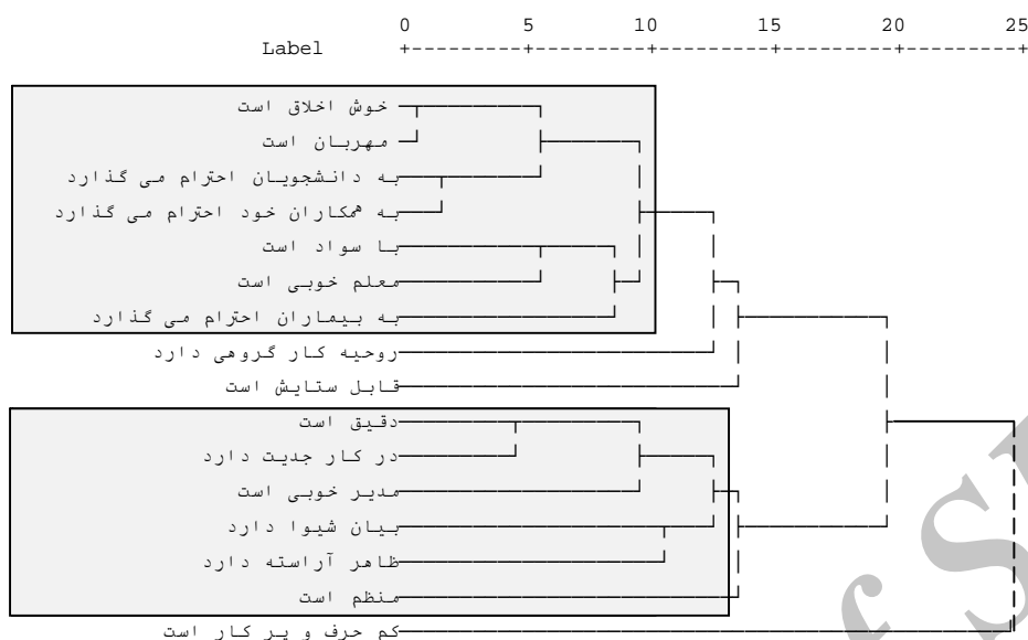
نمودار 2. نمودار دندروگرام همبستگی و رابطه بین ویژگی‌های شخصیتی و علمی الگوهای رفتاری مثبت

نشان داده است. ویژگی کم حرفی و پرکاری، کمترین ارتباط را با دو دسته تشکیل شده در نمودار دارد.