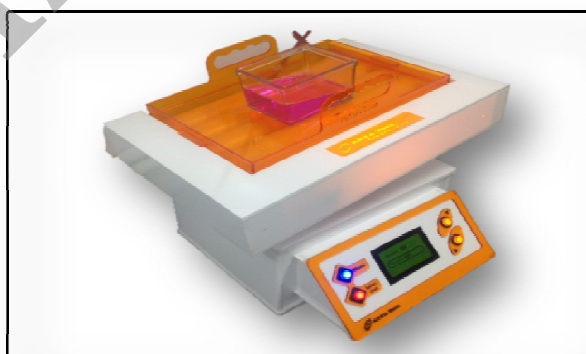
تصویر شماره ۳. نمایی از دستگاه در هنگام عملیات تخلیط

یا در مثالی دیگر مواد آزمایشگاهی باید در داخل ظرف های مخصوص به صورت الکلنگی و در سطح بالایی مایع میکس شوند، که در قسمت راکر دستگاه این امر صورت