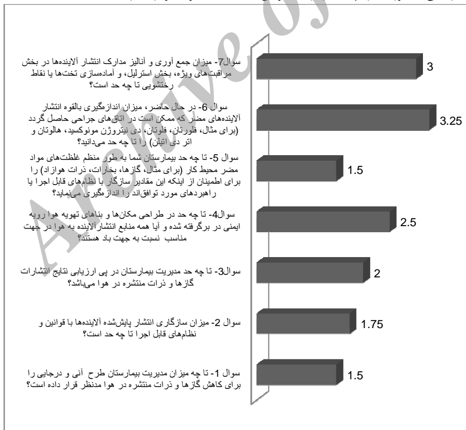
نمودار شماره 1. میانگین امتیاز داده شده به پرسش های پرسش نامه در رابطه با شرایط مدیریت انتشار آلاینده ها به هوا در بیمارستان های آموزشی

بخش های خاص بیمارستان ها که با مواد زائد خطرناک سروکار دارند با میانگین 4/25 به عنوان مهم ترین نقطه قوت معرفی شد، این در حالی بود که قوانین خاصی برای چگونگی ذخیره مواد زائد خطرناک وجود نداشت و عدم وجود برنامه ای مکتوب و دقیق برای حذف مواد زائد حاوی جیوه با میانگین 2/25 و عدم وجود معیارهای سنجش برای کاستن، حذف یا بهبود مدیریت مواد شیمیایی خطرناک و سمی قابل تجمع زیستی پایدار در بیمارستان های آموزشی با میانگین 2/5 به عنوان مهم ترین نقاط ضعف در این زمینه بود. در بخش ششم به چگونگی مدیریت آب در بیمارستان های آموزشی پرداخته شد. نتایج مشاهده ها و تکمیل پرسش نامه نشان داد که بالاترین امتیاز به بررسی منظم نظام های لوله کشی آب نشت با میانگین 3/75 تعلق گرفت که نشان دهنده ارزیابی ادواری مناسب این بخش از مدیریت است. در بخش هفتم و مدیریت فاضلاب، نتایج نشان داد که در تمام بیمارستان های مورد مطالعه آنالیزهای شیمیایی و میکروبی فاضلاب صورت نمی گیرد، به طوری که بررسی و نظارت بیمارستان های آموزشی بر فاضلاب بیمارستانی به طور منظم جهت سازگاری با قوانین