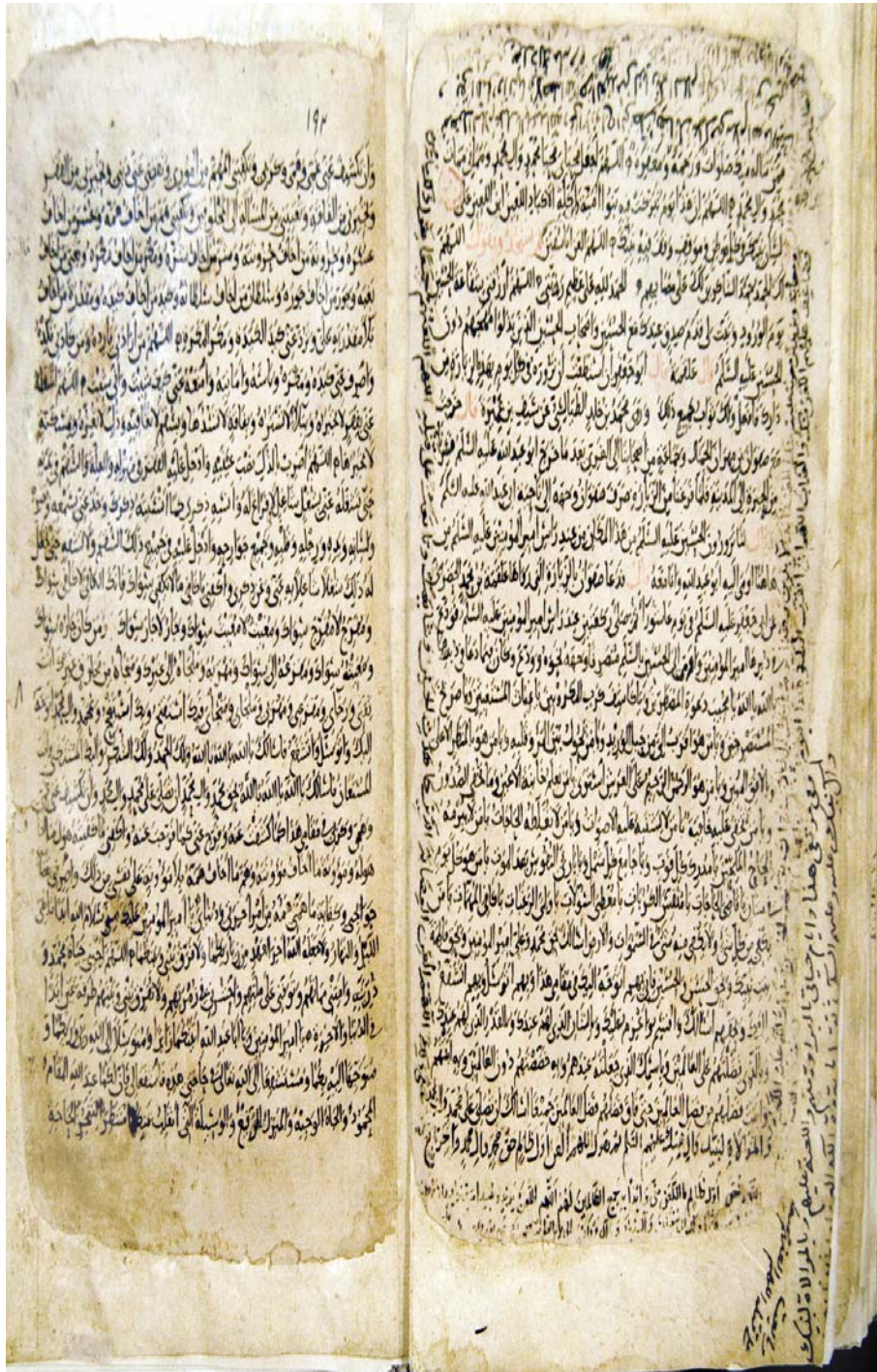
شماره ۸: موجود در کتابخانه آستان قدس