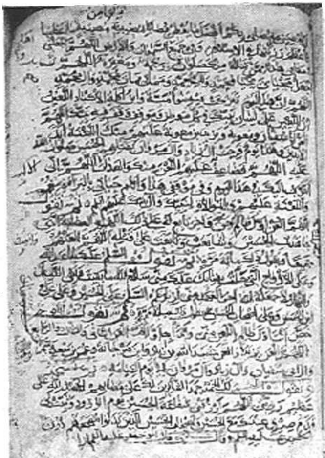
شماره ۹: موجود در کتابخانه بروجردی