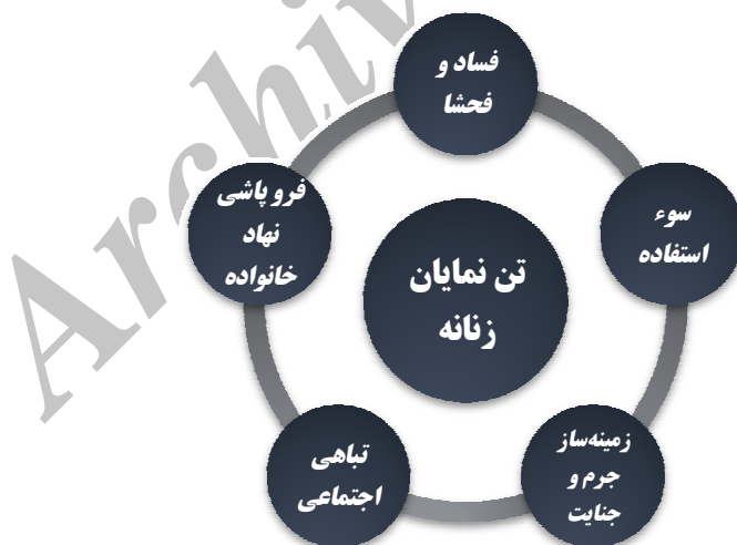
نمودار شماره ۲. مفصل‌بندی گفتمان مقاومت

همچنین فروپاشی نهاد خانواده را از پیامدهای جامعه‌ای می‌داند که در آن امر جنسی به واسطه حضور تن‌نمایان زنان به سرعت در حال انتشار است. «۲۰ هزار قربانی کوچولوی طلاق، چنان سخاوتمندانه اجازه می‌دهیم که فیلم‌های سینمایی و تلویزیونی و هنرنمایی‌های پاره‌ای از مطبوعات و کاباره‌ها و مانند آن‌ها همه سرمایه‌های ما را غارت کنند و جوانان و حتی بزرگسالان ما را به ابتذال بکشند، که هیچ آدم غافل و بی‌خبری چنین نمی‌کند...» (مکتب اسلام، ۱۳۵۲: شماره: ۳).