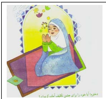
تصویر شماره ۲: آمادگی برای جشن تکلیف