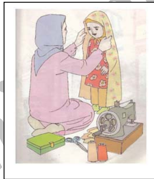
تصویر شماره ۴: چادر، به عنوان نشانه‌ای از جداسازی زود هنگام کودکان

دیروز در بازار بودیم. مادرم از فروشگاه، پارچه‌ی گل‌دار قشنگی خریده بود. او در راه، دکان‌ها را به من نشان می‌داد و می‌گفت: این‌جا نجاری است [نجار...]. وقتی به خانه رسیدیم، مادرم با آن پارچه، چادر نماز قشنگی برای من دوخت. من از او خیلی تشکر کردم (فارسی، بخوانیم، پایه اول، ۱۳۹۳: ۸۲).