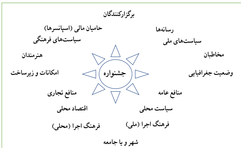
عوامل مؤثر بر برگزاری یک جشنواره فرهنگی/هنری (منبع Hauptfleisch, 2007: 43)

در برگزاری یک جشنواره تلویزیونی عوامل و متغیرهای متعددی مؤثر هستند. هاپفلیچ (2007) به عوامل و متغیرهایی که به یک جشنواره شکل می‌دهند، اشاره کرده است. این موارد شامل برگزارکنندگان، حامیان مالی (اسپانسرها)، رسانه‌ها، سیاست‌های ملی، سیاست‌های فرهنگی، امکانات و زیرساخت‌های موجود، وضعیت جغرافیایی، منافع عامه و عموم مردم، منافع تجاری، سیاست محلی، اقتصاد محلی، فرهنگ اجرا (در سطح ملی)، فرهنگ اجرا (در سطح محلی) و سرانجام شهر و یا جامعه‌ای است که قرار است جشنواره در آنجا برگزار شود. این موارد در شکل زیر نیز به نمایش درآمده است.