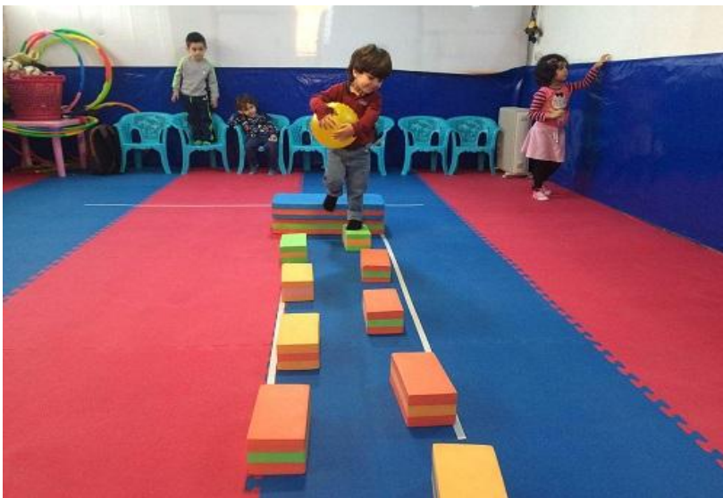
تصویر ۱: بازی گذشتن از روی آجرهای فومی همراه با نگهداشتن توپ در دست، به منظور توسعه مهارت تعادل پویا (کودکان ۴ تا ۵ سال)

با توجه به محدودیتهای مالی و زمانی مهدکودکها، ظرفیت توجه و یادگیری این گروه سنی و بر اساس مطالعه‌ای که مارشال و هاردمن ۱ در سال ۲۰۰۰ انجام دادند، یک جلسه ۴۵ دقیقه‌ای در هفته برای فعالیت حرکتی این گروه سنی از کودکان در نظر گرفته شد (مارشال و هاردمن، ۲۰۰۰). در برنامه آموزشی روپا ۲۵۰ بازی متنوع با ابزارهای ساده‌ای چون تخته استپ، آجر فومی، طناب، سبدهای پلاستیکی، توپ در ابعاد مختلف، حلقه‌های هولاهوپ، چسب کاغذی و بادکنک طراحی شدند. این برنامه برای ۹ ماه دوره آموزشی و به شکل طبقه بندی شده برای گروههای سنی ۳ تا ۴ سال، ۴ تا ۵ سال و ۵ تا ۶ سال طراحی شد (تصاویر شماره ۱ و ۲). مثلاً طرح درس در ماه اول نسبت به ماه دوم و سوم تغییر پیدا می‌کرد. یک نمونه از طرح درس برنامه آموزشی روپا در جدول شماره ۲ آمده است.