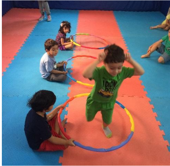
تصویر ۲: بازی پریدن از داخل حلقه‌های هولاهوپ به شکل خرگوش با هدف افزایش قدرت عضلات پا و توسعه تعامل