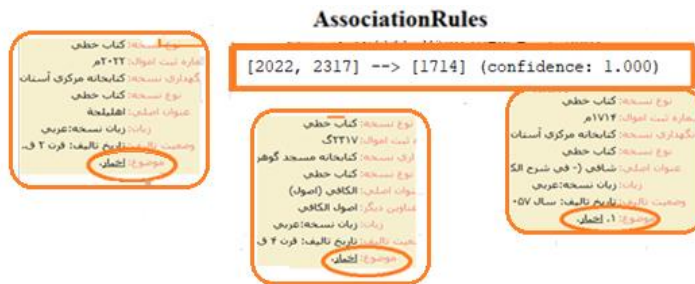
شکل ۴. نمایی از قوانین ایجاد شده و مطابقت آن با موضوع اخبار

در این قسمت می‌توان به نتایجی که از تطبیق میان شماره‌های ثبت در قوانین ایجاد با موضوعات منابع (نسخ خطی) به وجود آمده است چنین تفسیر نمود: