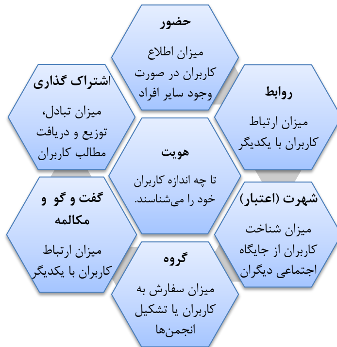
شکل ۱. چارچوب لانه زنبوری رسانه‌های اجتماعی (برگرفته از کیتزمان، سیلوستر و مک‌کارتی، ۲۰۱۲، ص. ۲۴۳)

هویت محدود‌های را نشان می‌دهد که کاربران میزان هویت خود را در فضای رسانه‌های اجتماعی آشکار می‌کنند. گفت‌وگو و مکالمه نشان می‌دهد تا چه میزان کاربران در محیط رسانه‌های اجتماعی با یکدیگر ارتباط برقرار می‌کنند. اشتراک‌گذاری نشان‌دهنده مقدار محتوایی است که کاربران آن را مبادله کرده، توزیع نموده و یا دریافت می‌کنند (کاپلان و هنلین ۱ ، ۲۰۱۰). منظور از «ارتباط» این است که دو یا چند کاربر به نحوی معاشرت کنند که منجر به گفت‌وگو و اهداف اجتماعی مشترک شود. حضور بیانگر این است که تا چه حد کاربران می‌توانند بدانند آیا کاربران دیگر قابل دسترس می‌باشند یا نه (عقیلی و قاسم‌زاده عراقی، ۱۳۹۴). شهرت و اعتبار از جنس اعتماد است و گروه‌های آنلاین می‌توانند مشابه باشگاه‌های دنیای آنلاین باشند (پارنت، پلانجر و بل ۲ ، ۲۰۱۱).