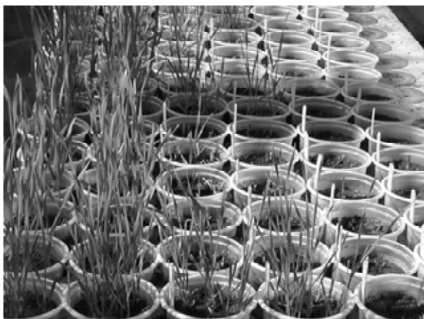
شکل ۲: بازیافت ژنوتیپ های گندم سه هفته پس از تیمار یخ زدگی در شرایط کنترل شده.

رسم نمودارها با استفاده از نرم افزارهای MS-Excel، MSTAT-C و SigmaStat انجام گرفت. کلیه میانگین‌ها با آزمون LSD مقایسه شدند.