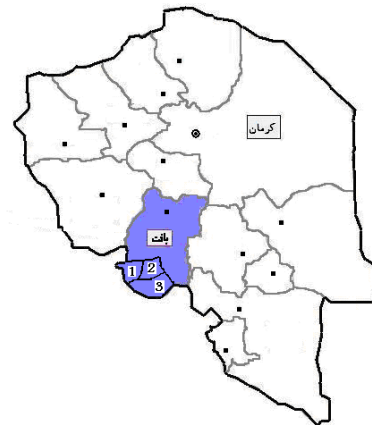
نقشه ۱- محل وقوع اپیدمی در روستاهای وکیل آباد (۱)، سلطان آباد

پیرو گزارش مرکز بهداشت استان کرمان در اوایل بهار ۱۳۷۷، در مناطق جنوبی شهرستان بافت افزایش بی‌سابقه‌ای از موارد لیشمانیوز پوستی مشاهده گردید. با توجه به اینکه در این منطقه کانون جدیدی از سالک ایجاد شده بود و بیم آن می‌رفت که بیماری به صورت کانونی فعال جهت انتقال موارد به دیگر نقاط