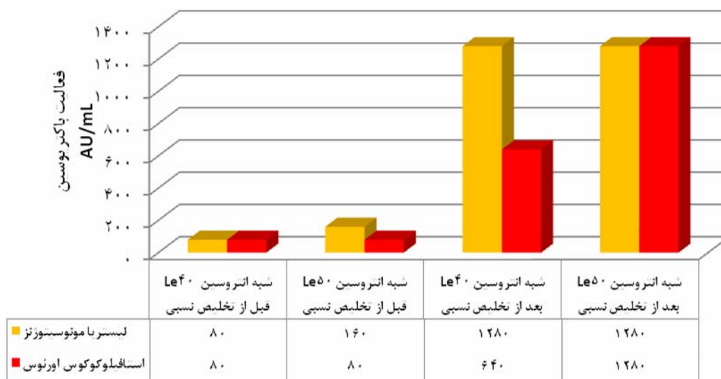
شکل ۲- فعالیت شبه انتروسین‌های دو سویه Le40 و Le50 قبل و بعد از تخلیص نسبی روی باکتری‌های شاخص استافیلوکوکوس اورئوس و لیستریا مونوسیتوژنز