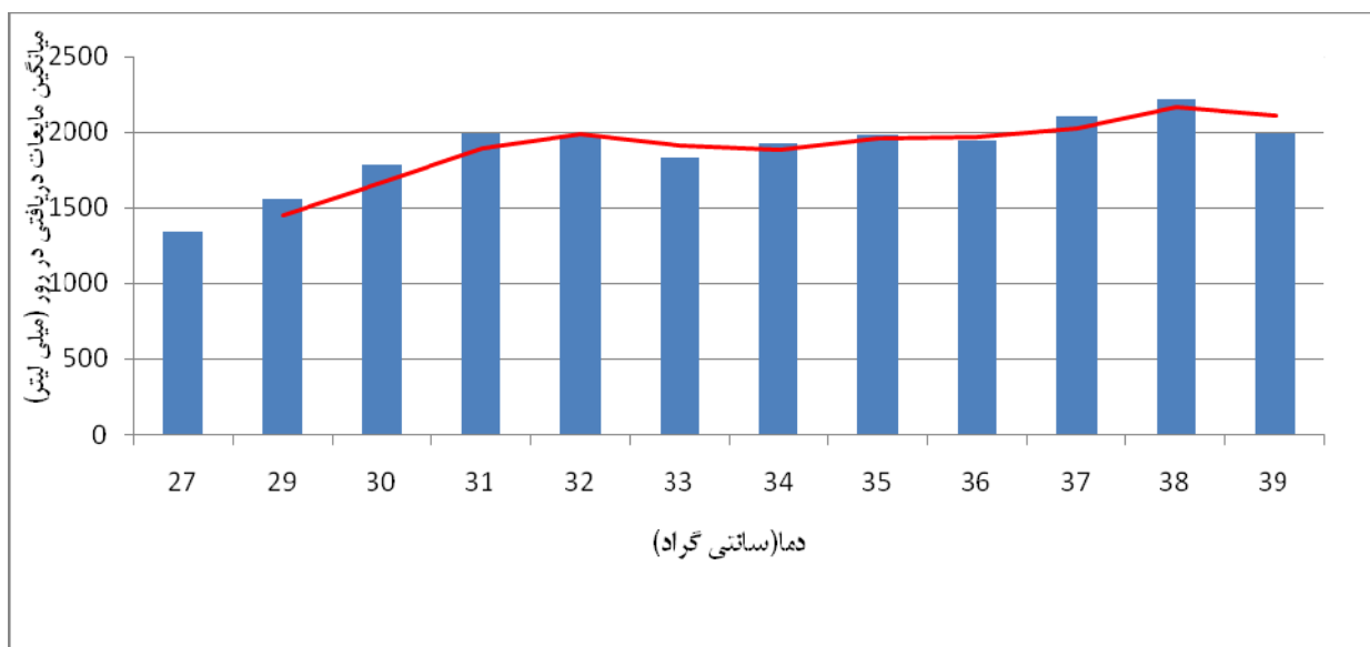
نمودار ۲. میانگین مصرف مایعات در دمای روزهای بررسی