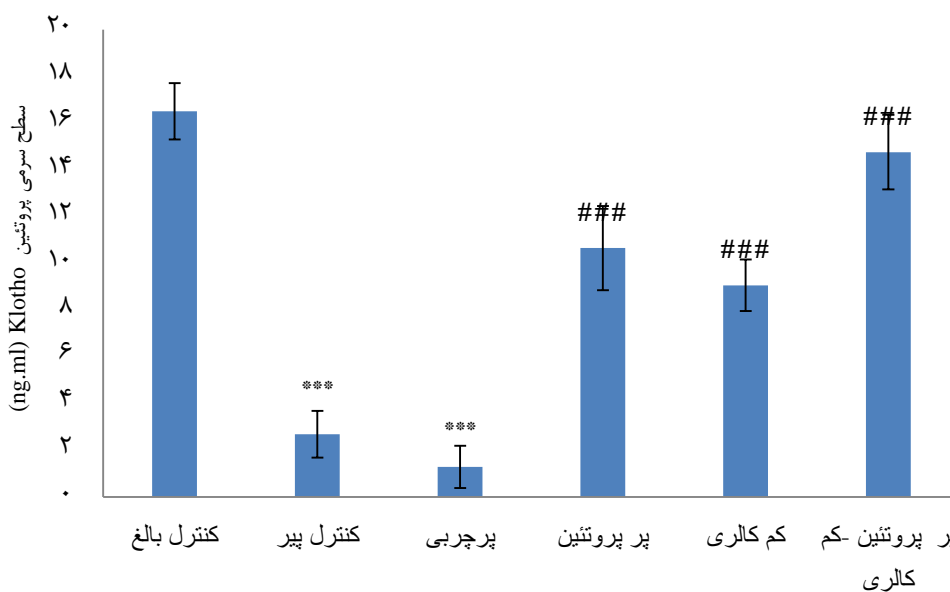
شکل ۱. سطح پروتئین Klotho در سرم خون موش‌های درمان شده با رژیم‌های غذایی مختلف که به وسیله روش الایزا انجام گرفت. ( P<0.001 *** مقایسه نسبت به گروه سالم بالغ و P<0.001 ### مقایسه نسبت به گروه پیر)

بررسی اثر رژیم‌های غذایی پر چربی، پر پروتئین و رژیم کم کالری بر فاکتورهای TGF- \beta 1, PDGF کبدی: شکل ۲ نشان دهنده سطح پروتئین‌های PDGF و TGF- \beta 1 در کبد موش‌ها در گروه‌های آزمایشی می‌باشد. داده‌ها در شکل ۲ الف نشان می‌دهد که میزان پروتئین PDGF در کبد در گروه پیر نسبت به گروه جوان کاهش معنی‌داری داشته است ( P=0/05 ). یافته‌های حاضر نشان می‌دهد که رژیم غذایی پر چربی سبب کاهش میزان پروتئین PDGF نسبت به گروه