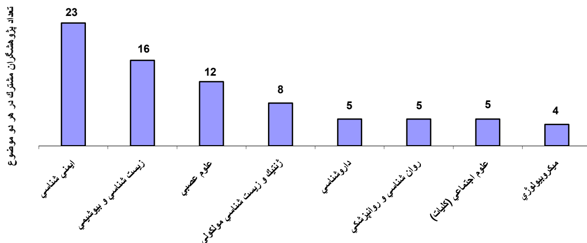
نمودار ۲: میزان ارتباط پزشکی بالینی با سایر موضوعات