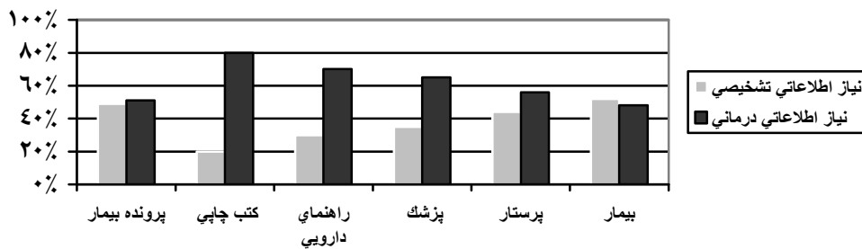
نمودار ۳: رابطه‌ی بین انواع نیازهای اطلاعاتی دانشجویان و منابع اطلاعاتی استفاده شده توسط دانشجویان پزشکی واحدهای اورژانس بیمارستان‌های آموزشی دانشگاه علوم پزشکی ایران در سال ۱۳۸۷