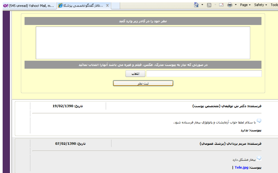
تصویر ۳: کنترل وضعیت بیمار

قبلی را به خاطر ندارد از وی درخواست شد که حال تشخیص بیماری را بر اساس شرح حال و تصاویر دیجیتال ثبت شده مشخص کند. اینکار بر روی حدود ۹۱ بیمار انجام شد. بعد از اتمام کار، تشخیص اولیه که با روش حضوری گذاشته شده بود با تشخیص‌هایی که با روش غیرحضوری بعد از دو ماه گذاشته شده بود با هم مقایسه گردید. داده‌های گردآوری شده توسط پرسش‌نامه توسط نرم افزار SPSS نسخه ۲۰ مورد تحلیل قرار گرفت.