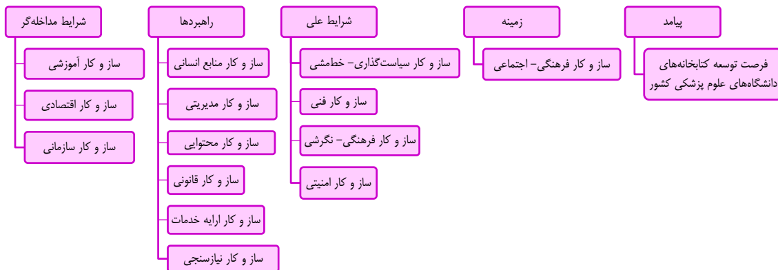
شکل ۳: مدل فن آوری واقعیت افزوده در کتابخانه‌های دانشگاه‌های علوم پزشکی

(۳۰)، Arroyo-Vazquez (۱۰)، Huang و همکاران (۳۴)، Esposito-Betan و Santos (۴۱)، Baumgartner-Kiradi و همکاران (۱۹)، ناخدا و ترکمان (۴۲)، مومنی (۱۴)، Di Serio و همکاران (۱۵) و LeMire و همکاران (۶) در تحقیقات خو عنوان کردند که فن آوری واقعیت افزوده فرصتی برای ارایه خدمات کتابخانه‌ای است. نتایج پژوهش Okunlaya و همکاران نشان داد که واقعیت افزوده برای ارایه خدمات گزینشی اطلاعات در کتابخانه‌ها کاربردی می‌باشد (۲۸). Wake و همکاران بیان کرد که خدمات بالینی را می‌توان با فن آوری واقعیت افزوده به صورت شبیه‌سازی آموزش داد (۴۳). Fujiuchi و Riggie با انجام مطالعه‌ای نتیجه‌گیری کردند که کتابخانه‌ها جهت آماده شدن برای ارایه خدمات به نسل آینده، باید از فن آوری واقعیت افزوده و مجازی استفاده کنند (۲۳). نمایش موقعیت جغرافیایی کاربر و ارایه اطلاعاتی مانند مسیر دسترسی، مسافت، مکان جغرافیایی و... ارایه خدمات مبتنی بر مکان خارج از محل کتابخانه (۲۷، ۱۹) با استفاده از واقعیت افزوده در تعیین موقعیت مکانی کاربر نسبت به کتابخانه ارایه می‌شود.