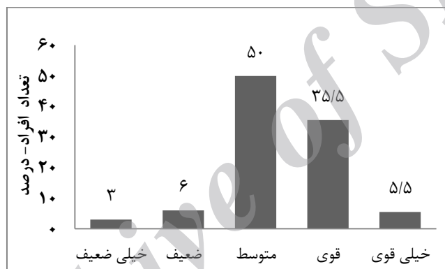
نمودار ۱- اثربخشی کلی برنامه‌های تلویزیونی کشاورزی از دیدگاه بهره‌برداران