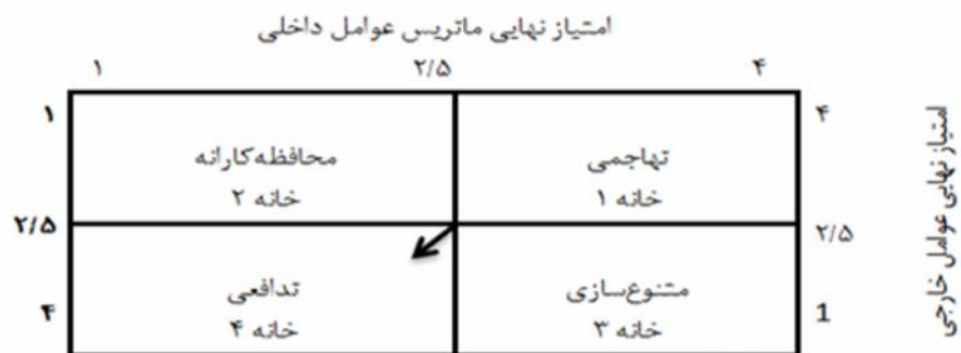
نگاره ۲- ماتریس داخلی و خارجی نظام مدیریت دانش سازمان جهاد کشاورزی خوزستان

۱) ابتدا عوامل داخلی و خارجی و همچنین امتیاز نهایی هر کدام از آن‌ها به جدول برنامه‌ریزی استراتژیک منتقل شد. سپس کلیه‌ی استراتژی‌های تدافعی، در ردیف بالای ماتریس برنامه‌ریزی استراتژیک فهرست شدند. ۲) برای تعیین جذابیت هر استراتژی تدافعی، بنا بر اهمیت هر یک از عوامل چهارگانه SWOT در تدوین آن استراتژی امتیازی از ۱ تا ۴ داده شد. ۳) برای به‌دست آوردن ارزش جذابیت، امتیاز نهایی هر عامل در امتیاز جذابیت آن استراتژی ضرب شد، بدین ترتیب ارزش جذابیت هر یک از عوامل برای هر استراتژی مشخص شد. ۴) در مرحله آخر، از جمع ارزش‌های جذابیت هر ستون جدول برنامه‌ریزی استراتژیک، امتیاز ارزش نهایی جذابیت هر یک از استراتژی‌های تدافعی به‌دست آمد که نشان‌دهنده‌ی استراتژی‌هایی است که از جذابیت بیشتری برخوردار هستند (جدول ۴).