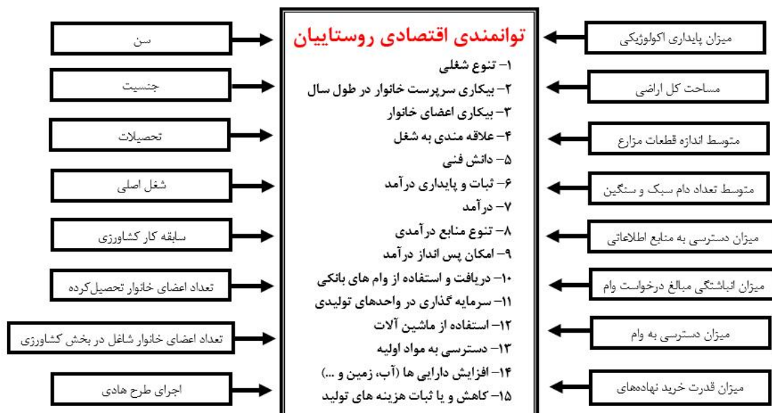
نگاره ۱- چارچوب مفهومی پژوهش

اقتصادی- اجتماعی بر توانمندی اقتصادی روستاییان را مورد آزمون قرار دهد. برای این منظور، عوامل مؤثر اخذ شده از مطالعات کتابخانه‌ای شناسایی، جمع‌آوری و به‌صورت چارچوب مفهومی پژوهش حاضر ارائه شده‌اند (نگاره ۱).