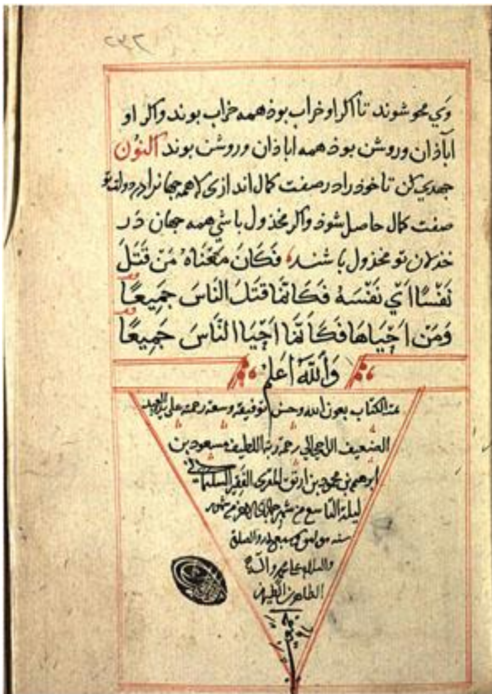
(تصوير شماره ۲)