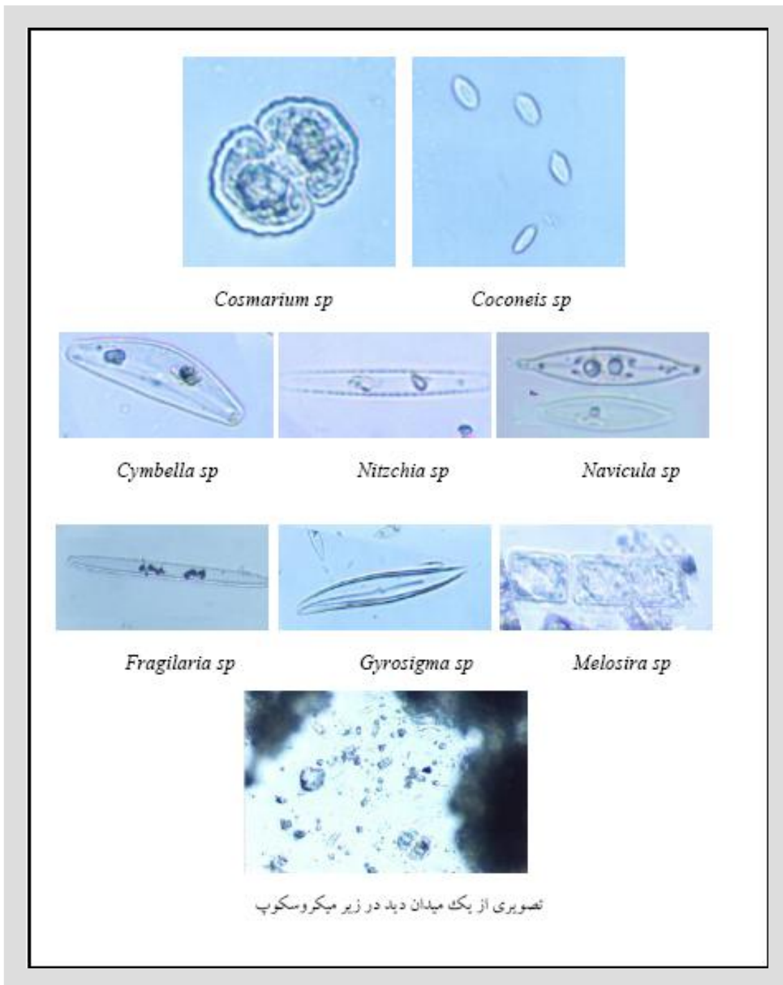
شکل 2- برخی از جنس‌های مشاهده شده در رژیم غذایی سیاه‌ماهی ( C. capoeta gracilis )