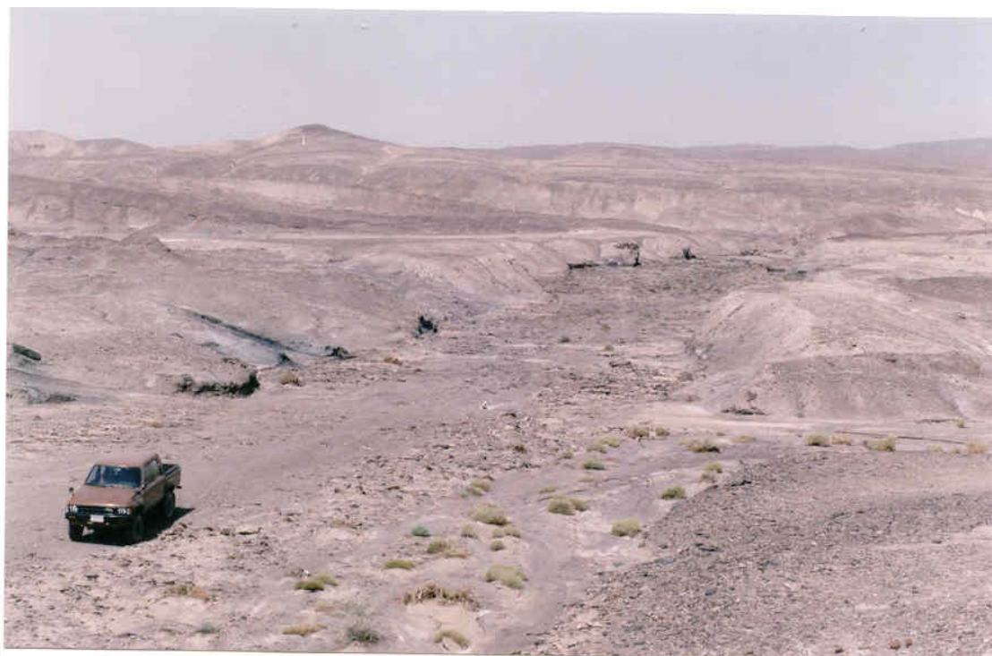
شکل ۳- نمائی از آبراهه‌های بخش غربی معدن مزینو (دید به سمت غرب)