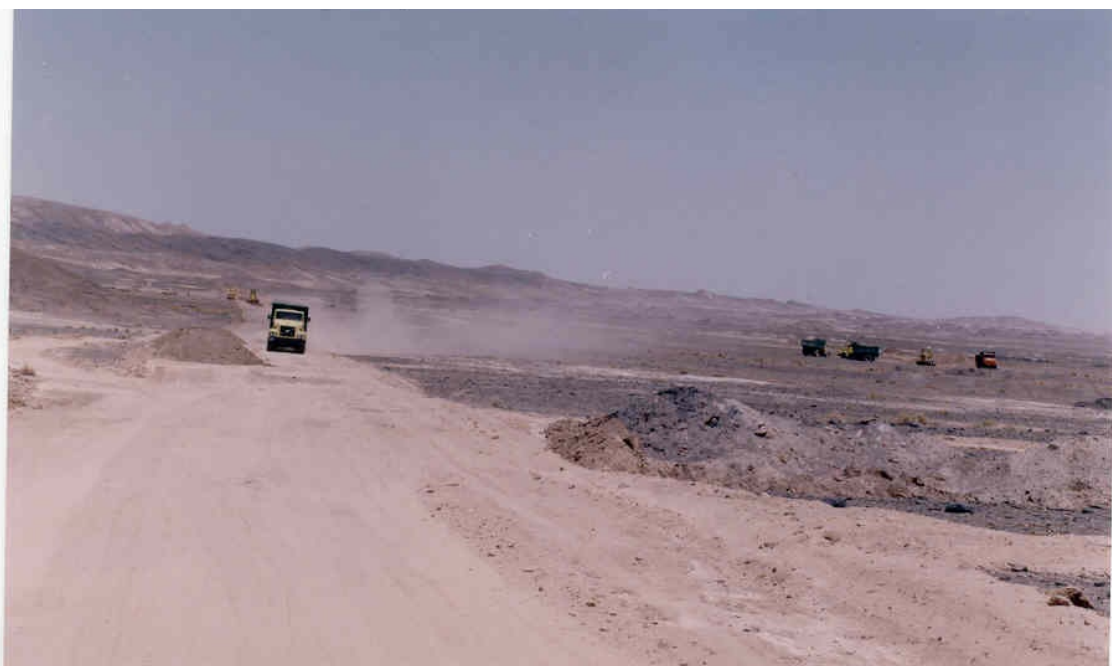
شکل ۵ - نمائی از آبراهه‌های بخش غربی معدن مزینو (دید به سمت غرب)