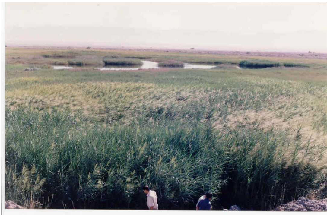
شکل ۴- نمائی از آبراهه‌های بخش غربی معدن مزینو (دید به سمت غرب)