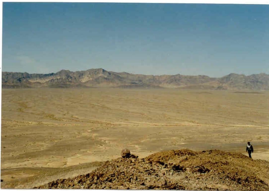
شکل ۲- نمائی از بخش مرکزی معدن مزینو (دید به سمت شمال)