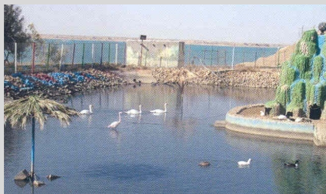
شکل ۲- چاه‌نیمه‌های سیستان