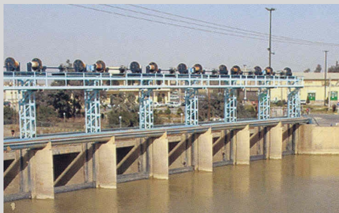
شکل ۳- سد زهک