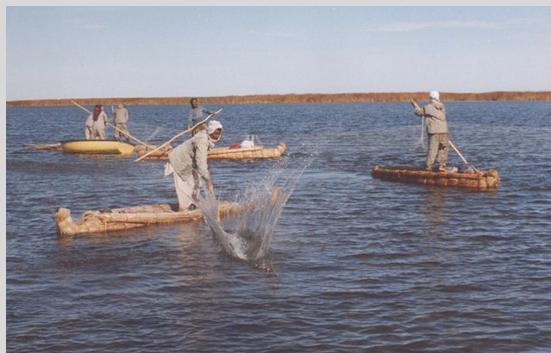
شکل ۱- تالاب هامون

قابل اهمیت هستند. دریاچه هامون یعنی تنها دریاچه آب شیرین و منحصر به فرد در نواحی مرکزی و شرقی ایران از دیرباز زیستگاه مناسبی جهت انواع و اقسام آبزیان، مرغان آبی و به‌ویژه پرندگان مهاجر بوده و می‌تواند در خلق چشم‌اندازهای زیبا و آفرینش فعالیت‌های ورزشی چون قایق‌رانی، ماهیگیری و اسکی روی آب بسیار سودمند باشد (Beikmohammadi, 1995). علاوه بر این، دارای پتانسیل بسیار بالایی در زمینه توتن سواری، ۴ شنا، شکار و بازدید از پوشش گیاهی و حیات وحش جانوری است.