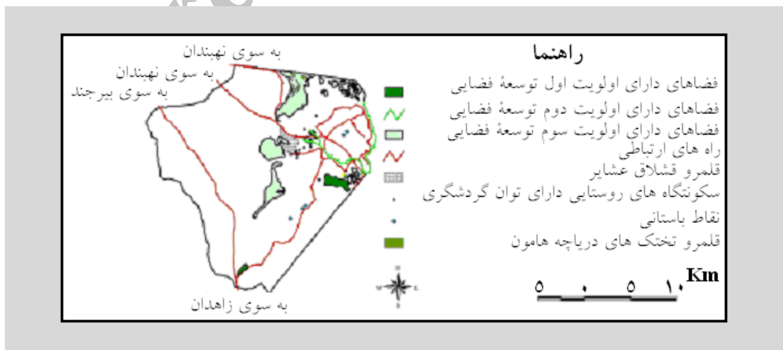
شکل ۵- اولویت‌های توسعه فضایی اکوتوریسم سیستان و پراکنش فضایی قابلیت‌های توسعه طبیعت‌گردی

امروزه نگرش به توسعه پایدار و لزوم حفظ محیط‌زیست، بیش از هر زمان دیگر مورد توجه قرار گرفته است. اکوتوریسم یا طبیعت‌گردی به دلیل توجه به مسایل زیست‌محیطی، دارای بیشترین سازگاری با توسعه پایدار است. این گونه از گردشگری که فعالیت‌های فراغتی انسان را در طبیعت امکان‌پذیر می‌سازد، در قرن بیست و یکم از چنان اهمیتی برخوردار می‌شود که سازمان ملل متحد برای نشان دادن اهمیت جهانی آن، سال ۲۰۰۲ را سال بین‌المللی اکوتوریسم و قرن بیست و یکم را قرن اکوتوریسم نامیده است. ایران نیز به عنوان یکی از پنج کشور برخوردار از بیشترین تنوع محیطی و یکی از ده کشور تاریخی-فرهنگی دنیا، دارای موقعیت ممتازی در