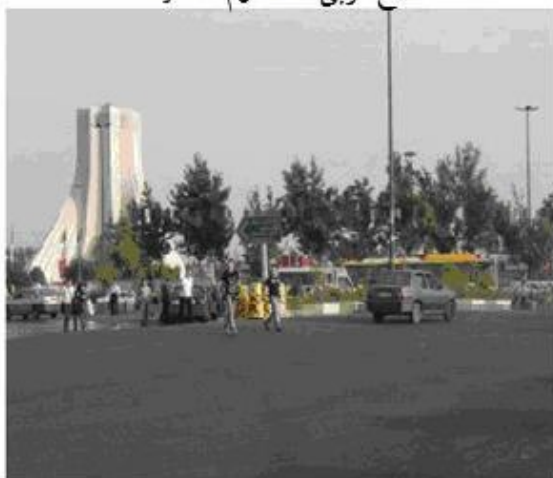
ضلع شمال غربی میدان آزادی