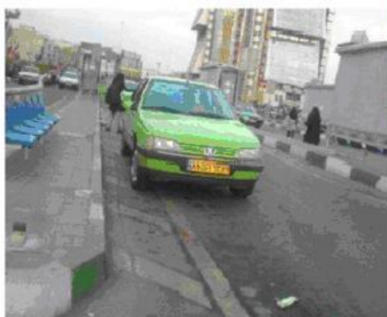
ضلع غربی فلکه دوم صادقیه