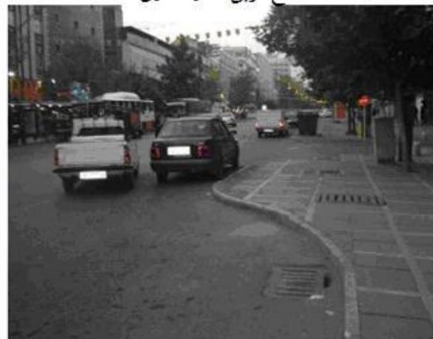
ضلع شمالی میدان ولیعصر