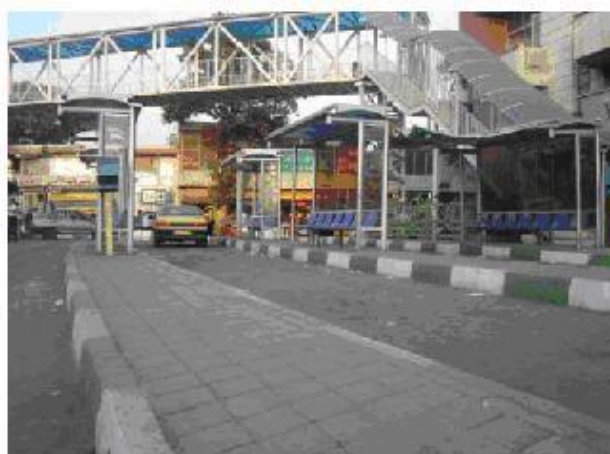
ضلع غربی سه راه آذری