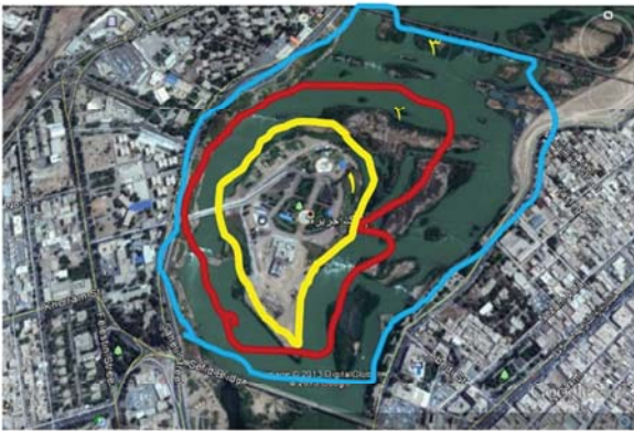
۱- داخل پارک ۲- سواحل پارک ۳- آب های اطراف پارک شکل ۱- محدوده مطالعاتی پرندگان پارک جزیره شادی در زمستان ۱۳۹۲ و بهار ۱۳۹۳