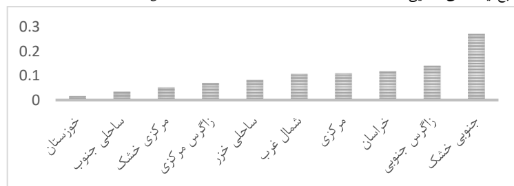
شکل ۳- سود خالص حاصل از اجرای الگوی کشت بهینه محصولات باغی کشور سال ۱۳۹۲