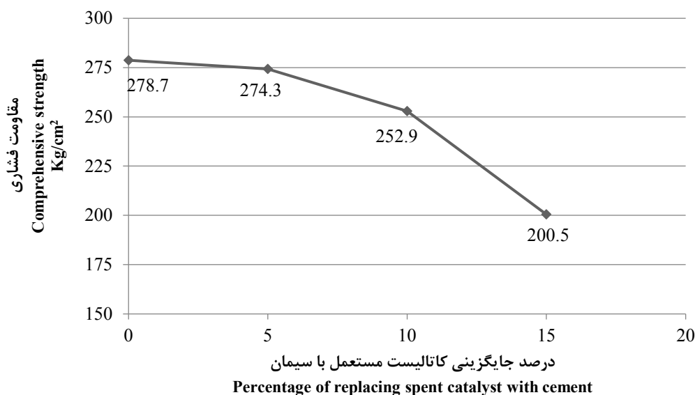
شکل ۲- تأثیر استفاده از پسماند کاتالیست بر روی مقاومت فشاری ۷ روزه بتن Fig. 2- Effect of using the spent catalyst on the 7 days compressive strength of concrete

شکل ۲ تغییرات مقاومت فشاری ۷ روزه نمونه‌های ساخته شده بتن با درصد‌های مختلف پسماند کاتالیست را نشان می‌دهد.