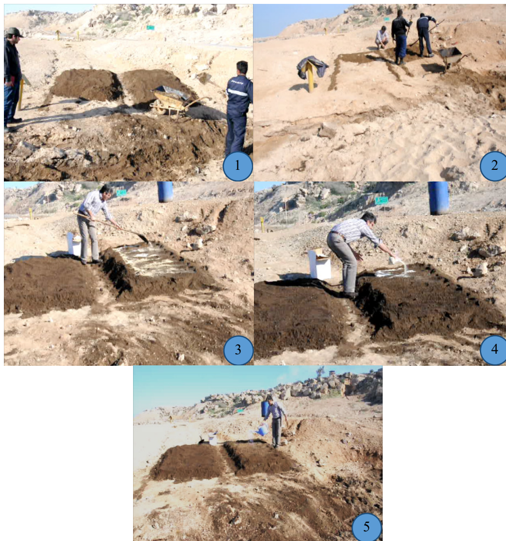
شکل ۱- اجرای عملیات آزمون پایلوت میدانی زیست پالایی خاک‌های آلوده به نفت خام با استفاده از نمونه پودری کنسرسیون میکروبی تجزیه کننده آلاینده‌های هیدروکربنی