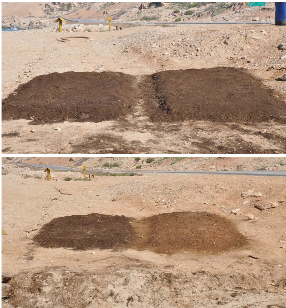
شکل ۳- عکس از نمونه شاهد (چپ) و نمونه مورد آزمایش (راست) در روز اول (بالا) و روز چهاردهم (پایین). تغییر رنگ خاک آلوده در نمونه مورد آزمایش نشان از تجزیه هیدروکربن‌های نفتی موجود در آن می‌باشد