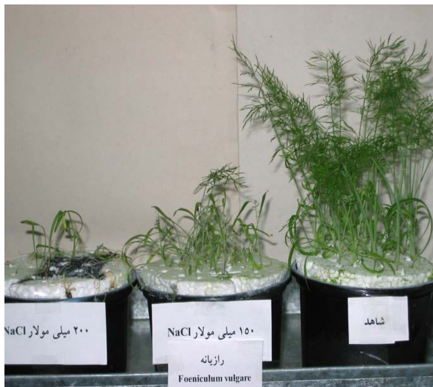
شکل ۱- مقایسه طول ساقه رازیانه، در غلظت‌های مختلف شوری با شاهد، در مرحله گیاه کامل