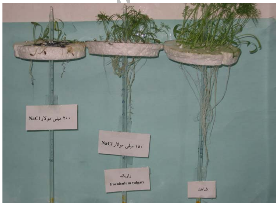
شکل ۲- مقایسه طول ریشه رازیانه، در غلظت‌های مختلف شوری با شاهد، در مرحله گیاه کامل