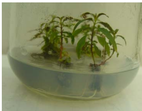
شکل ۴- گیاه اکالیپتوس گرنديس در مرحله سازگاری