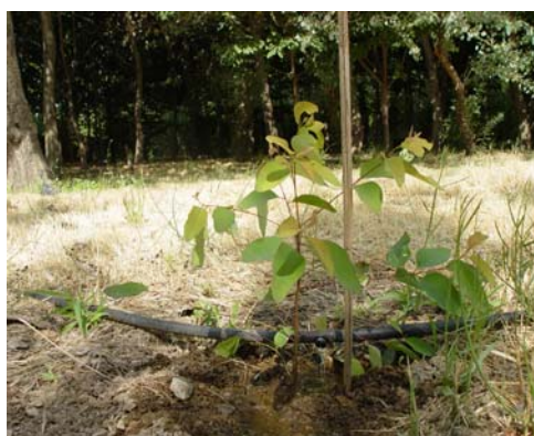
شکل ۵- گیاه اکالیپتوس گرنديس استقرار یافته در مزرعه