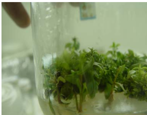
شکل ۲- شاخه‌زایی اکالیپتوس گرنديس