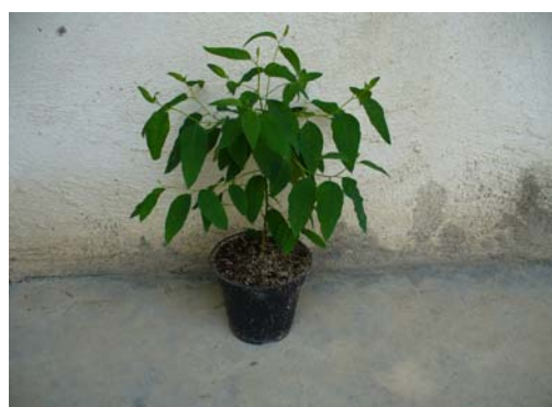
شکل ۳- ریشه‌زایی شاخه‌های اکالیپتوس گرنديس