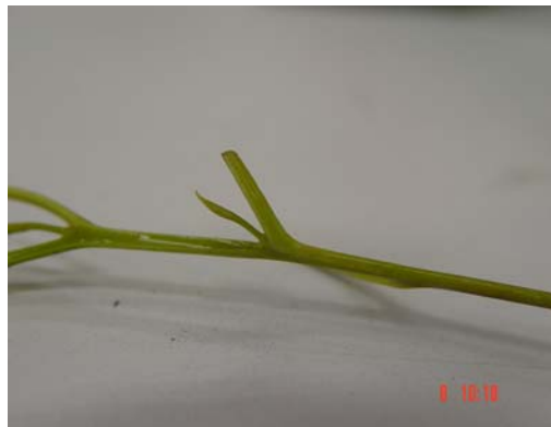
شکل ۱- جوانه قابل کشت اکالیپتوس گرنديس