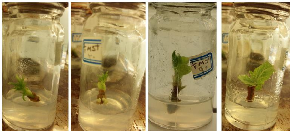
شکل ۱- کشت نمونه‌های سترون شده برای استقرار اولیه در محیط کشت 1/2MS و آغاز رشد در آنها

نمونه‌ای از تفاوت رشد در محیط‌های مختلف کشت مورد مطالعه از نظر تعداد و طول شاخه در شکل ۲ ارائه شده است. پایه‌های مورد مطالعه از نظر تولید ریشه در سطوح مختلف محیط کشت هم تفاوت صفر و یک با یکدیگر نشان دادند. به این مفهوم که پایه شماره ۲ در همه محیط‌های کشت مورد مطالعه تولید ریشه کرد ولی سایر پایه‌ها در هیچ یک از