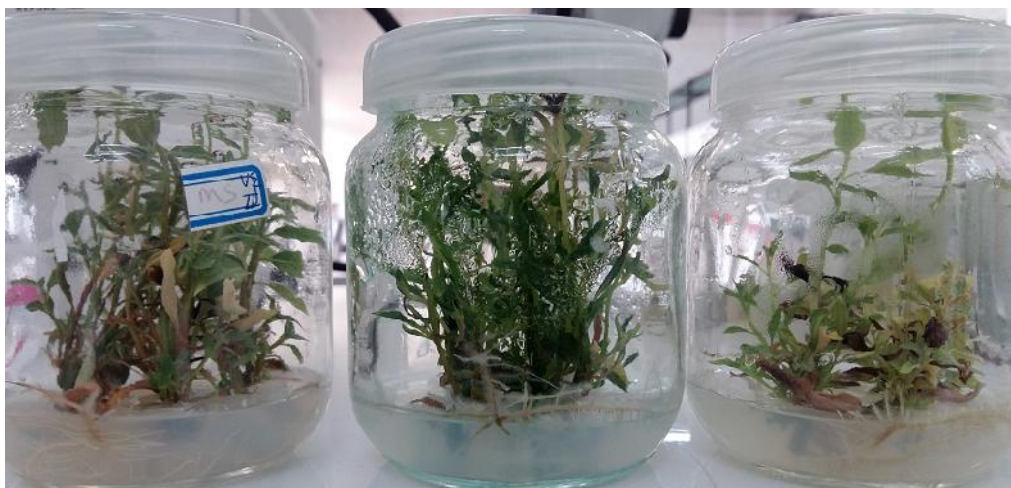
شکل ۳- ریشه‌دهی یکی از پایه‌های دورگ در محیط تکثیر و پرآوری

محیط‌های کشت رتبه سوم را به خود اختصاص داد ( شکل ۴د). از نظر طول برگ هم دقیقاً همین شرایط حاکم بود (شکل ۴ج) ولی از نظر آماری این اثرات معنی‌دار نشدند (جدول ۲). از نظر تعداد جوانه تولیدی هم اگرچه تغییر رتبه در سطوح محیط کشت وجود داشت ولی بیشتر تفاوت اختلاف بین میانگین پایه‌ها در سطوح سه‌گانه محیط کشت بود که سبب معنی‌دار شدن اثر متقابل پایه و محیط کشت شد (شکل ۴).