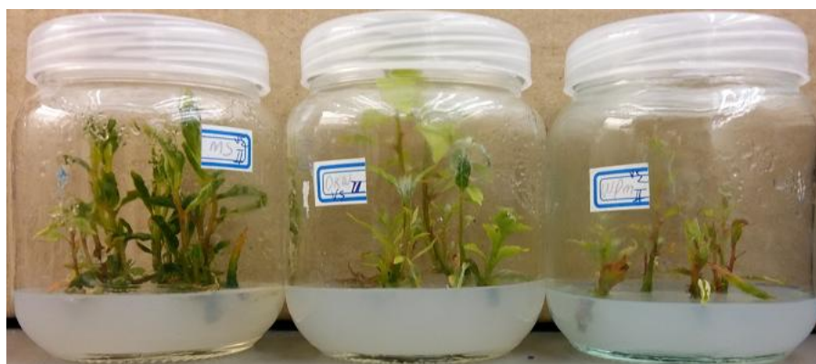
شکل ۲- تفاوت رویش یک نمونه ثابت در محیط‌های کشت سه گانه مورد استفاده در مرحله تکثیر و پرآوری

ns = غیر معنی‌دار، * و ** = معنی‌دار در سطح یک، پنج و ده درصد، ns = غیر معنی‌دار