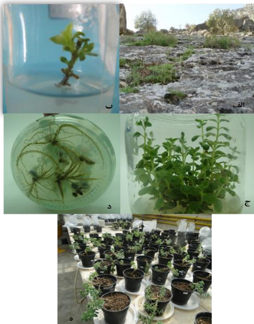
شکل ۳- مراحل مختلف ریزازدیادی Satureja khuzistanica . الف- جمع آوری از رویشگاه پل دختر لرستان، ب- رشد جوانه در مرحله استقرار، ج- نوساخه‌زایی در محیط بهینه (MS+۰/۳ mg/l 2iP+۰/۵mg/l BAP+۰/۱mg/l IBA)، د- نوریشه‌زایی در محیط بهینه (MS+۱ mg/l IBA+۰/۱ mg/l NAA)، ه- گیاهان سازگار شده در گلخانه