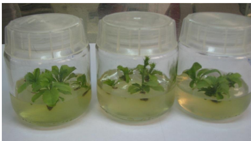
شکل ۱- تولید شاخساره بر روی محیط کشت DKW دارای ۱/۵ میلی‌گرم در لیتر BA، ۰/۰۱ میلی‌گرم در لیتر IBA و دو میلی‌گرم در لیتر GA_3 در زرشک بی‌دانه

‡: میانگین‌های هر ستون که دارای حرف‌های یکسانی هستند در سطح احتمال ۵ درصد آزمون چنددامنه‌ای دانکن با یکدیگر اختلاف معنی‌دار ندارند.