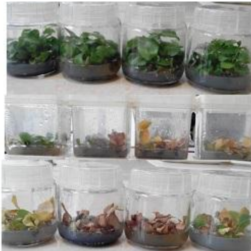
شکل ۳- واکنش شاخساره‌های درون شیشه‌ای زرشک بی‌دانه در محیط کشت‌های مختلف انگیزش ریشه (غلظت IBA در محیط کشت از چپ به راست به ترتیب ۰٫۲۵، ۵۰، ۷۵ و ۱۰۰ میلی‌گرم در لیتر) و زمان‌های مختلف (به ترتیب از بالا به پایین ۴۸، ۷۲ و ۱۲۰ ساعت) بعد از ۴ هفته قرار داشتن در محیط کشت بدون تنظیم‌کننده رشد

غلظت اکسین سالم و سبز ماندند ولی هیچگونه ریشه‌زایی مشاهده نشد. شاخساره‌هایی که به مدت ۷۲ و ۱۲۰ ساعت در محیط کشت انگیزش ریشه قرار داشتند در همه غلظت‌های اکسین به تدریج قهوه‌ای و در نهایت خشک شدند (شکل ۳). البته درصد خشک شدن در محیط کشت‌های با غلظت بیشتر اکسین بیشتر و شدیدتر بود.