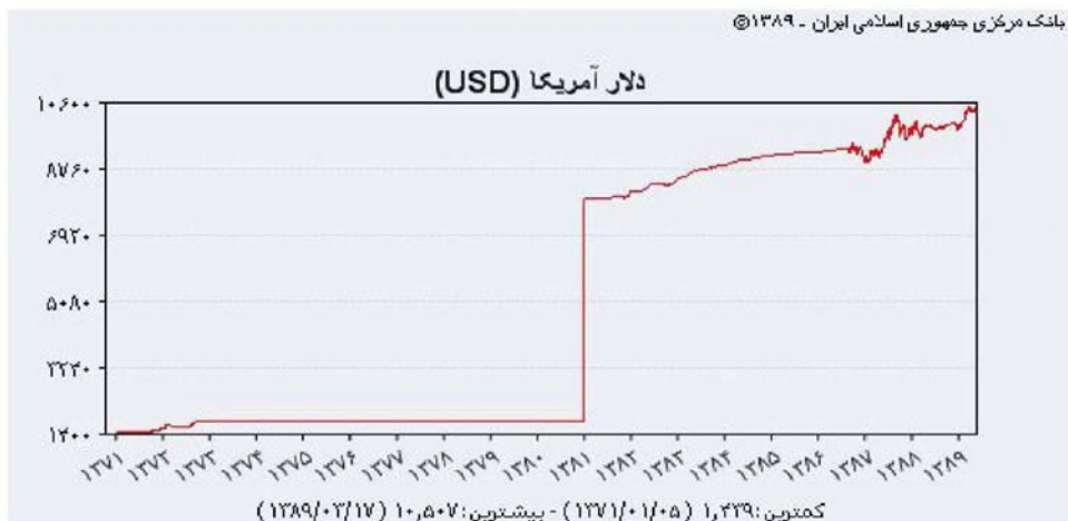
شکل ۱: نمودار نرخ ریال ایران در برابر هر دلار آمریکا

نمی باشد، که شکل ۲ نمودار درصد تغییرات لگاریتم نرخ ریال ایران در برابر هر دلار آمریکا گویای این واقعیت می باشد. بنابراین در نظر گرفتن دو رژیم منطقی تر به نظر می رسد. ابتدا مدل اتورگرسیو خطی را به داده ها برازش داده، سپس مدل های SETAR و MSAR برازش داده می شود.