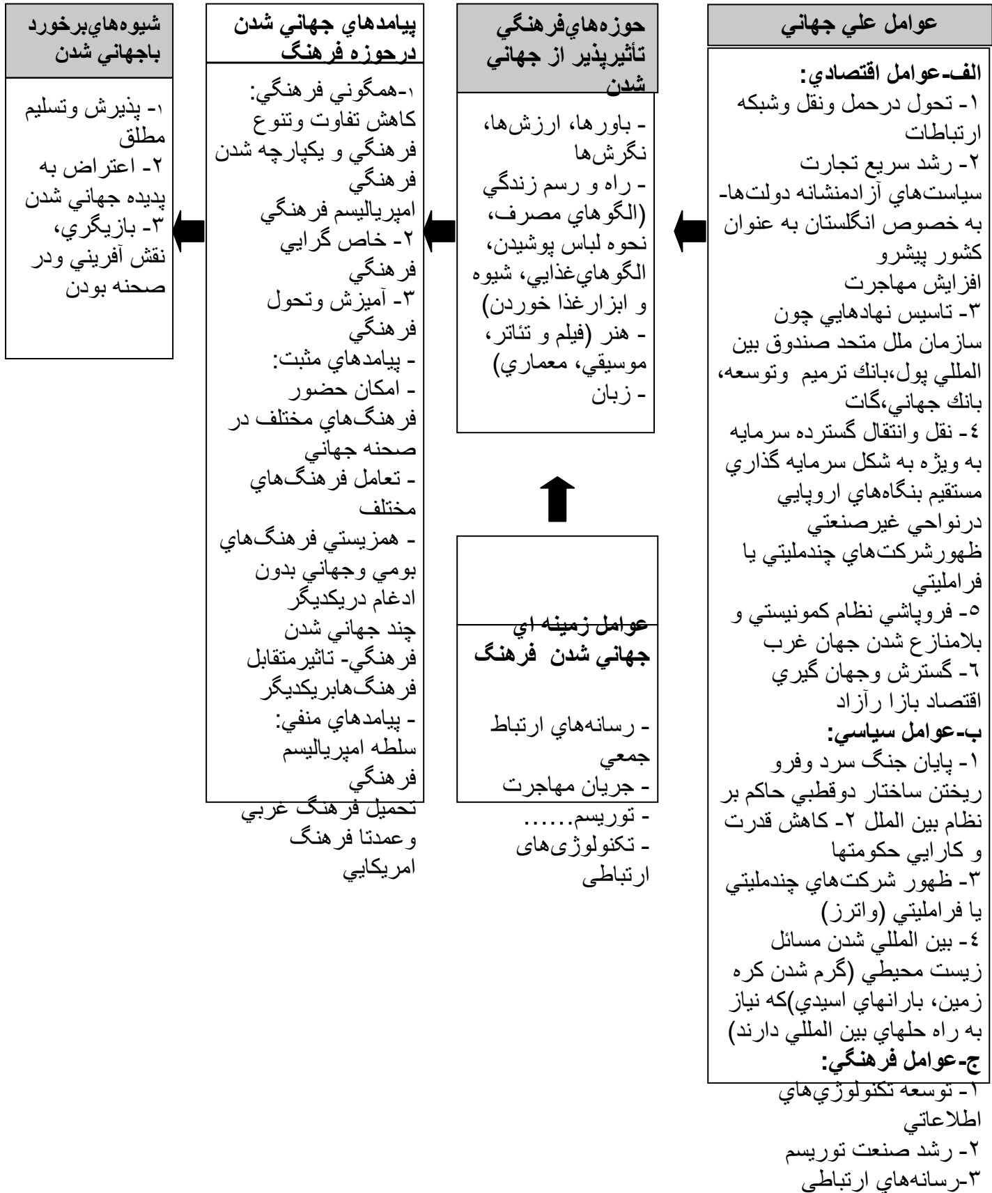
شکل ۱- مدل جامع جهانی شدن