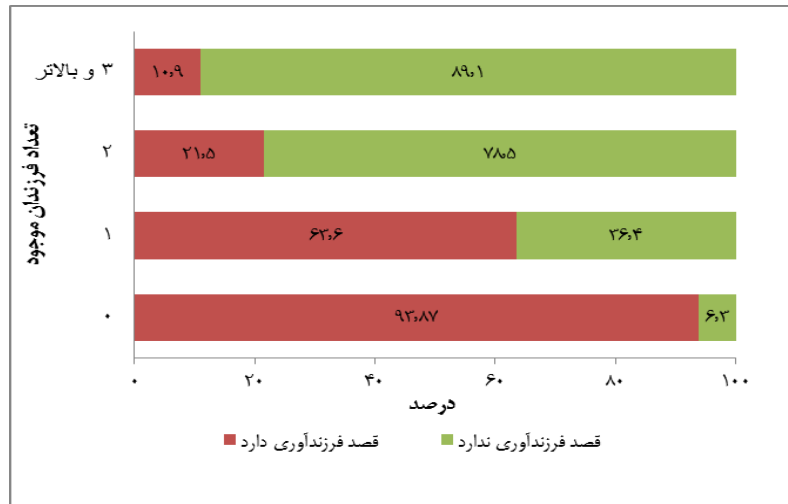
نمودار ۲. قصد فرزندآوری زنان ۱۵-۴۹ ساله دارای همسر بر اساس تعداد فرزندان موجود- شهر تهران، ۱۳۹۶

درصد از زنانی که در زمان تحقیق بدون فرزند بودند، اظهار داشته‌اند که قصد داشتن فرزند را ندارند و به عبارتی قصد بی‌فرزندی دارند. همچنین ۶۳/۶ درصد از افراد تک‌فرزند، نیز قصد دارند فرزند دیگری داشته باشند. با افزایش تعداد فرزندان از درصد افرادی که قصد فرزندآوری دارند کاسته شده است. برای مثال تنها ۲۱/۵ درصد از زنان دارای دو فرزند و ۱۰/۹ درصد از زنان دارای سه فرزند، قصد دارند که فرزند دیگری به دنیا بیاورند.