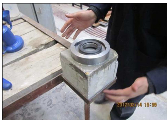
شکل ۲. نمونه‌ی بتن متصل‌شده به صفحه و آماده برای آزمایش. [۲۱]