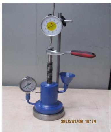
شکل ۱. دستگاه اندازه‌گیری نفوذپذیری با روش محافظه‌ی سیلندری. [۲۱]