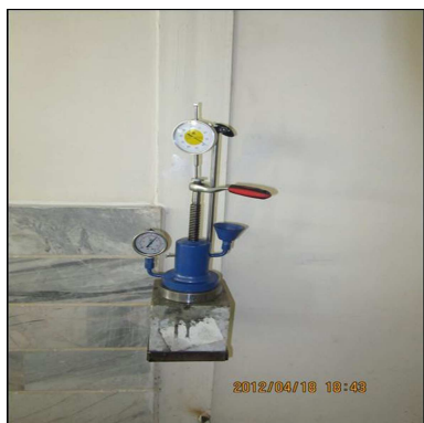
شکل ۳. نصب دستگاه اندازه‌گیری بر روی نمونه‌ی آزمایش. [۲۱]