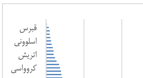
نمودار ۳. سهم کشورهای اروپایی از کمک مالی پیش‌بینی شده برای بازسازی اقتصادی (میلیارد یورو) برگرفته از داده‌های تارنمای کمیسیون اروپایی

روشن است که همه این اعتبارها برای کمک مستقیم به بنگاه‌ها و شرکت‌ها نیست. اما هر کشوری می‌تواند بخشی از آن را در اختیار این اشخاص قرار دهد. همچنین کشورها می‌توانند از راه سرمایه‌گذاری در زیرساخت‌های اقتصادی و افزایش گرایش به مصرف کالا و خدمات به کمک بنگاه‌ها و شرکت‌های زیان‌دیده بیایند. به هر حال، پیش‌نیاز دریافت چنین اعتباری بررسی و پذیرش برنامه بازسازی اقتصادی هر کشور از سوی کمیسیون و شورای اروپاست. این برنامه که دربرگیرنده اصلاحات و سرمایه‌گذاری است، باید نشان دهد در دو سال آینده (۲۰۲۱-۲۰۲۳) چه کارهایی در کشور هدف انجام خواهد گرفت تا پیامدهای زیان‌بار کووید-۱۹ جبران شود.