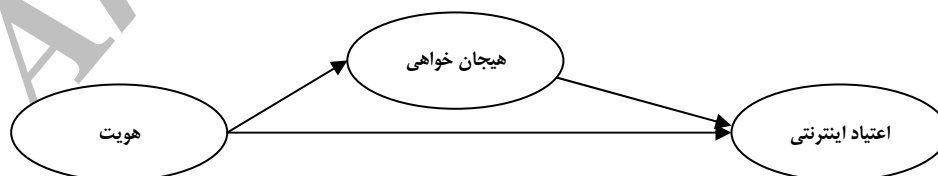
شکل ۱) الگوی پیشنهادی برای ارتباط بین هویت، هیجان‌خواهی و اعتیاد اینترنتی

همچنین هویت می‌تواند به واسطه هیجان‌خواهی بر اعتیاد اینترنتی اثر داشته باشد. با توجه به این که نوجوانان و جوانان در حال ساختن هویت خویش‌اند، ممکن است از رسانه به‌منظور تسکین اضطراب حاصل از تغییرات رشدی، جستجوی متناوب راه‌حل‌ها به‌منظور حل مشکلات، استحکام بخشیدن به انتخاب‌های خویش و شاید مهم‌تر نشان دادن خود و تفکرشان درباره این که چه کسی هستند یا خواهند شد، استفاده کنند. در این میان، عواملی از قبیل سرگرمی، تسکین تنش‌ها، همراهی با فرهنگ جمعی، آموختن درباره جهان، هیجان‌خواهی و دوری از تهایی، عوامل برانگیزاننده نوجوانان و جوانان در استفاده از رسانه‌ها هستند [۲۳].