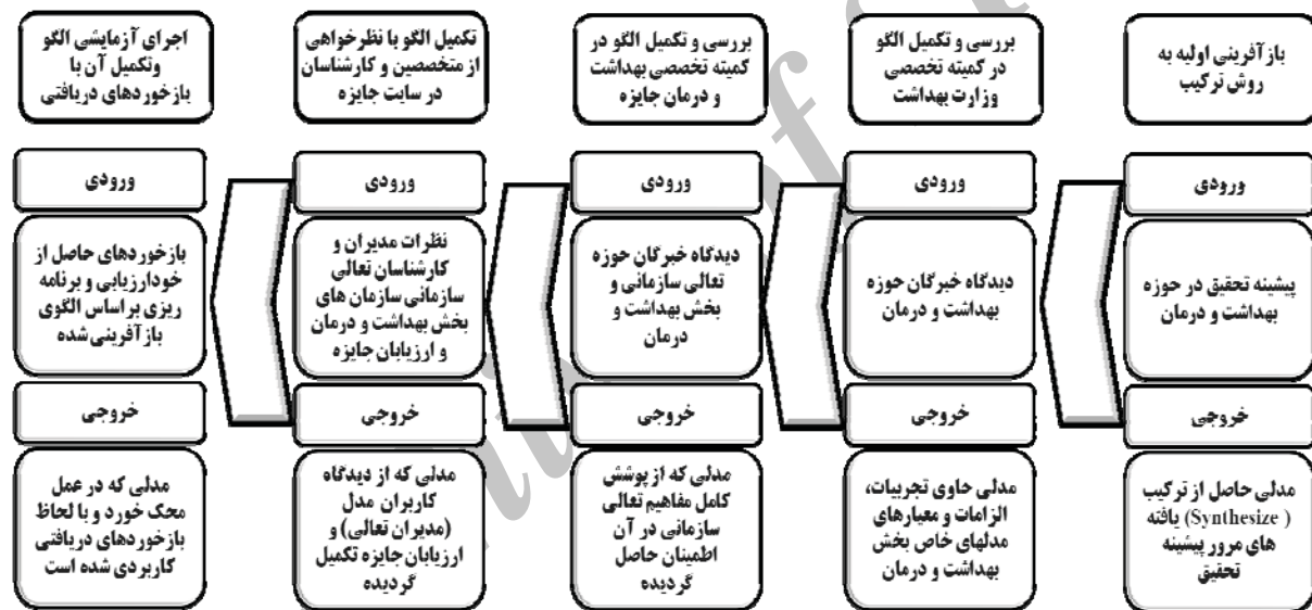
شکل ۲: فرآیند بازآفرینی الگوی تعالی سازمانی بخش بهداشت و درمان

برای بازآفرینی الگوی تعالی سازمانی بخش بهداشت و درمان فرآیندی پنج مرحله ای طراحی و اجرا شده است. مطابق شکل (۲)، در مرحله اول بازآفرینی از مطالعات کتابخانه ای و روش ترکیبی (Synthesize Method) استفاده و دو پرسشنامه جهت استفاده از نظر خبرگان با روش دلفی (Delphi Method) توسعه داده شده است. در مرحله دوم از آلفای کرنباخ برای آزمون قابلیت اطمینان پرسشنامه ها و از روش گروه های کانونی (Focus Group) برای اجماع توسط کمیته تخصصی وزارت بهداشت بر روی نکات استخراج شده