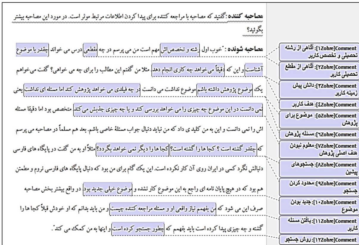
شکل ۱: نمونه ای از کد گذاری

باز، کد گذاری محوری و کد گذاری انتخابی انجام شد. به دلیل زیاد بودن حجم داده ها، کد گذاری انتخابی و محوری داده ها به طور جداگانه از کد گذاری باز انجام شد. در مرحله اول، کد گذاری باز بر ۱۰ مصاحبه انجام گرفت و تمرکز تحلیل بیشتر بر متن هر مصاحبه و به صورت جداگانه بود، بی آنکه ارتباط بین طبقات به دست آمده با یکدیگر مقایسه شوند (شکل شماره یک). سپس در صورت نیاز، مصاحبه