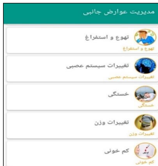
شکل ۳: مدیریت عوارض جانبی برنامه کاربردی خود مراقبتی بیماران مبتلا به سرطان پستان تحت شیمی درمانی