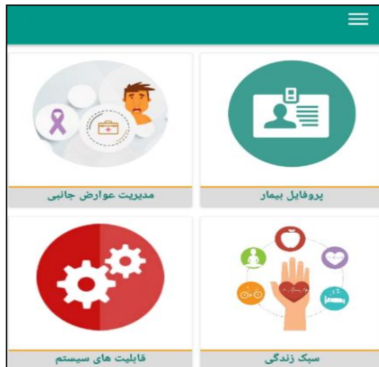
شکل ۱: صفحه اصلی برنامه کاربردی خود مراقبتی بیماران مبتلا به سرطان پستان تحت شیمی‌درمانی

در مرحله بعدی پژوهش، با توجه به نتایج به‌دست‌آمده در مرحله نیازسنجی برنامه کاربردی طراحی گردید. در قسمت پروفایل بیمار، کاربر داده‌های دموگرافیک و بالینی خود را وارد و با استفاده از دکمه ذخیره، این داده‌ها را ثبت می‌کند. در قسمت مدیریت عوارض جانبی، عوارض مختلف شیمی‌درمانی و راه‌های خود مراقبتی جهت مدیریت این عوارض ارائه شده است که با توجه به اینکه کاربر در چه زمینه‌ای نیاز به اطلاعات دارد، وارد بخش موردنظر خود می‌شود. در بخش سبک زندگی توصیه‌های خود مراقبتی در مورد تغذیه، فعالیت‌های بدنی، پیام‌های امیدبخش، سلامت معنوی، ترک سیگار و مدیریت استرس بیان شده است که در راستای خود مراقبتی